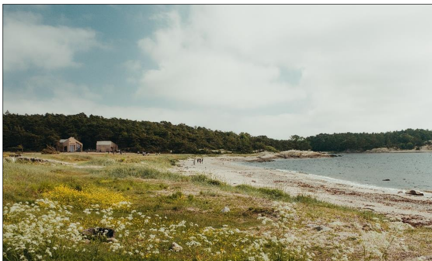
Figur 4. Storesand. Ytre Hvaler nasjonalpark. House of Ikigai/Visit Fredrikstad Hvaler. 2021

Hvaler kommunens kvaliteter kan utnyttes og videreutvikles for å fremme næringsutvikling og verdiskaping. Skjærgården, naturområdene, den rike og mangfoldige kulturarven, samt Ytre Hvaler Nasjonalpark, er alle viktige trekkplaster som gjør Hvaler til et populært reisemål, spesielt i sommermånedene. Med økt samarbeid og tilrettelegging kan disse naturgitte opplevelsene ha betydelig vekstpotensial og bidra til økt verdiskaping.