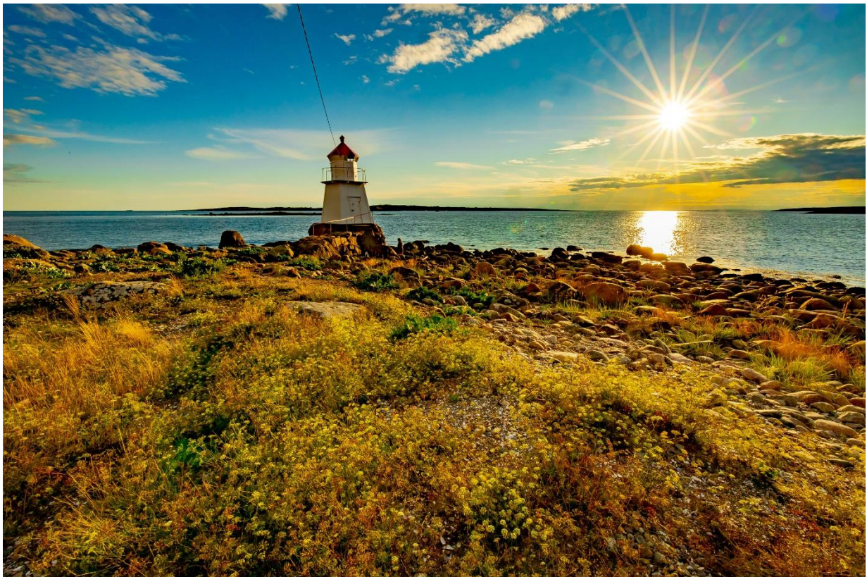
Figur 7. Pikesten fyrlykt på Brattestø. 2021.

Disse tiltakene vil bidra til å møte de mest presserende behovene i Hvaler, og sikre at kommunen utvikler seg på en måte som er bærekraftig, økonomisk robust, og attraktiv for både fastboende og besøkende.