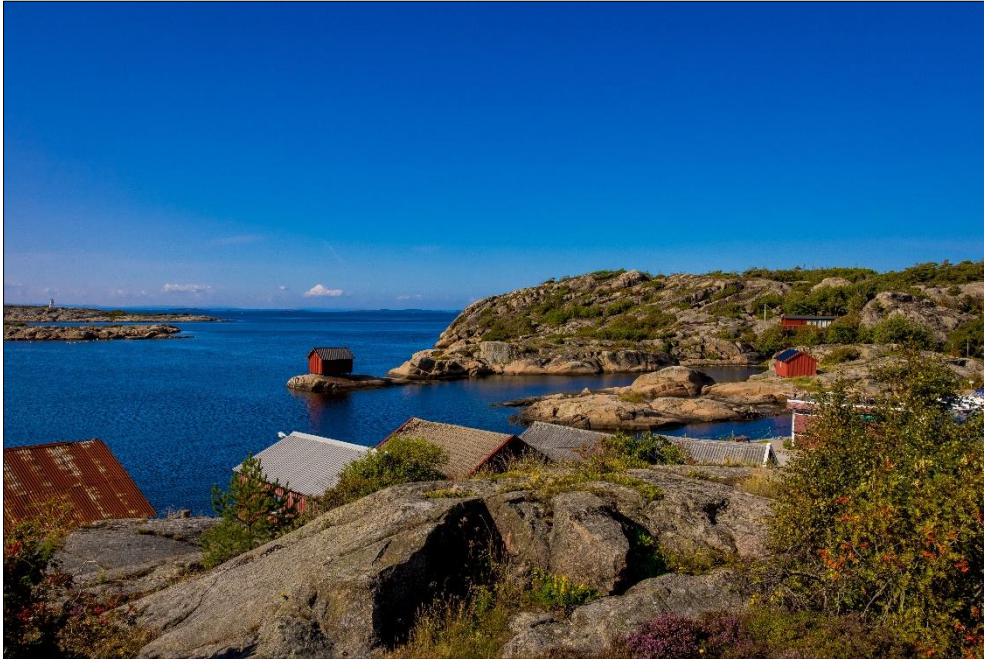
Figur 5. Papperhavn. Vesterøy, Hvaler. 2021