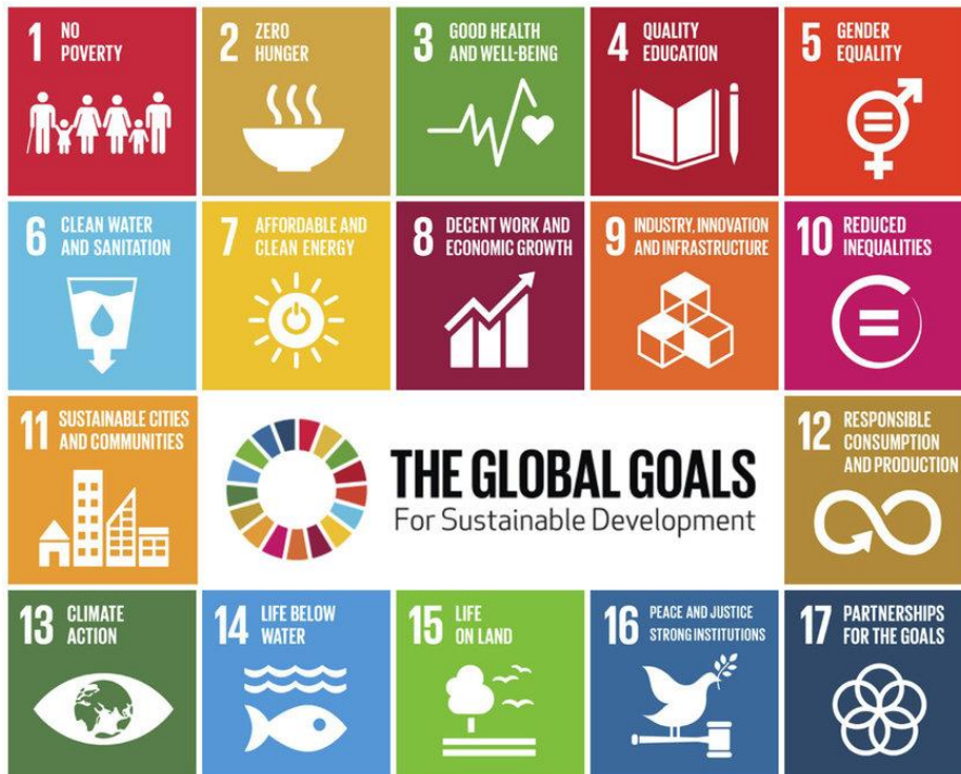
Figur 2. FNs 17 bærekraftsmål

FNs 17 bærekraftsmål skal være verdens felles arbeidsplan for å ta tak i vår tids største utfordringer og skal inngå som grunnlag for samfunns- og arealplanleggingen. De 17 målene konkretiseres gjennom 169 delmål.