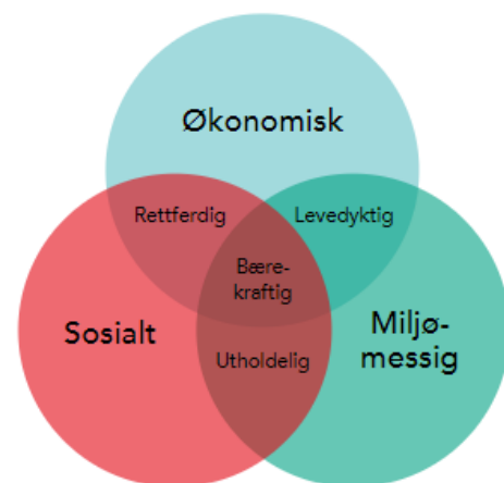
Figur 3. Bærekraftig utvikling består av tre dimensjoner: økonomi, miljø og sosiale forhold

FNs 17 bærekraftsmål er derfor et sentralt rammeverk for samfunns- og arealplanleggingen i Hvaler kommune. Hvaler har delt samfunnsdelen inn i tre satsingsområder: miljø og klima, sosiale forhold og økonomisk bærekraft. Lokale utfordringer og utviklingsmuligheter analyseres under hvert område, og strategiske hovedmål og delmål identifiseres basert på dette. Kommunen prioriterer tiltak som fornybar energi, bevaring av natur og jordbruk, reduksjon av forurensning og samarbeid med lokale og regionale aktører for å sikre en bærekraftig utvikling.